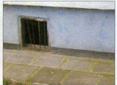
Okienko piwniczne przed wymianą.

- 2232 – na tylu metrach kwadratowych chodników prowadzono prace remontowe.