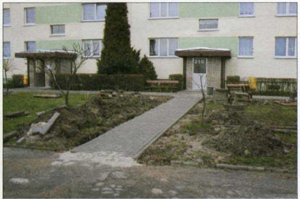
W zakresie prac budowlanych na 2011 rok były też remonty nawierzchni chodników.