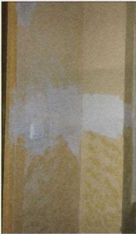
Fragment klatki schodowej przygotowany do malowania.