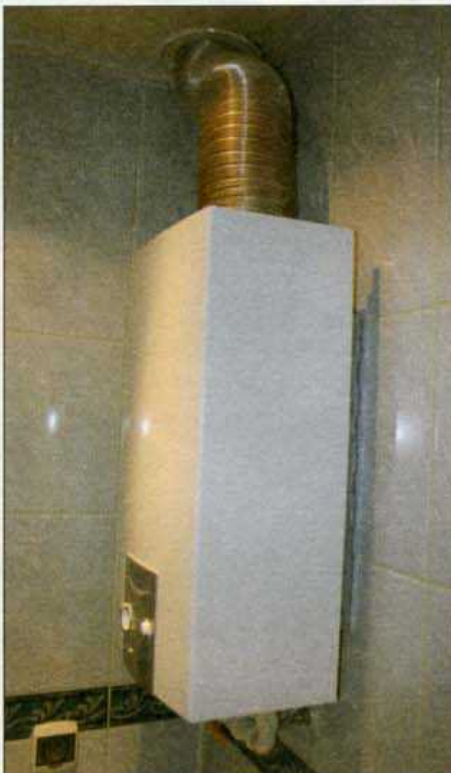
Tlenek węgla może okazać się niebezpieczny w łazienkach wyposażonych w piecyki gazowe.