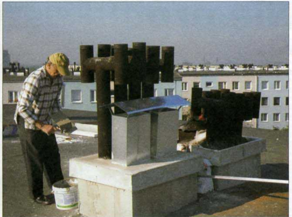
W ubiegłym roku wyremontowano 497 kominów na budynkach mieszkaniowych administrowanych przez naszą Spółdzielnię.