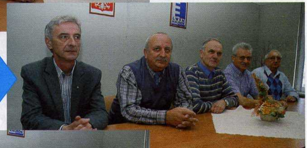
Rada Osiedla Wojska Polskiego II.