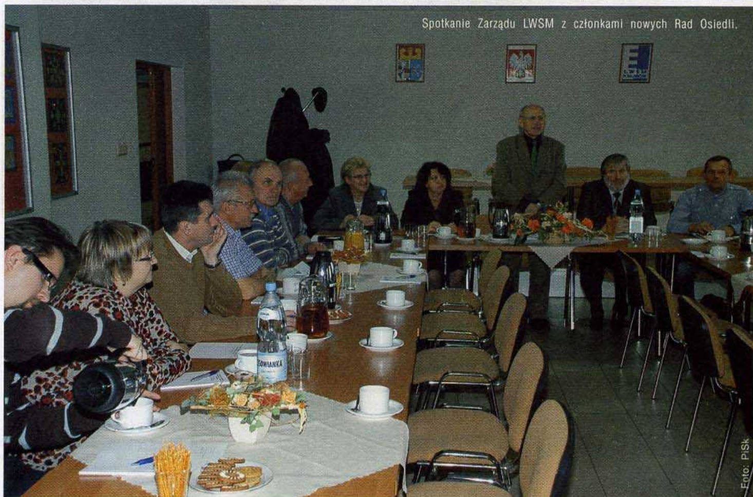
Spotkanie Zarządu LWSM z członkami nowych Rad Osiedli.