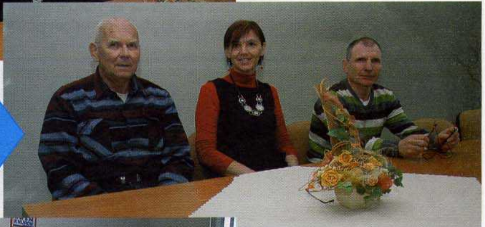
Rada Osiedla 1000-lecia.