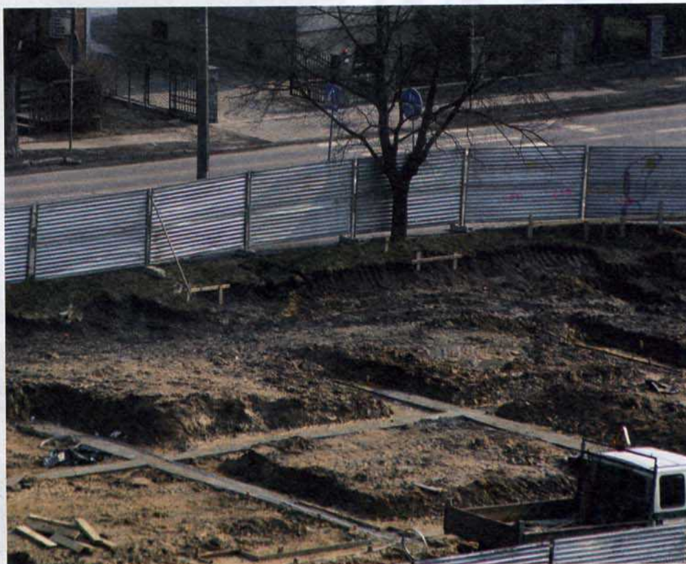
Przy ulicy Mieszka I powstaje pawilon handlowo-usługowy.