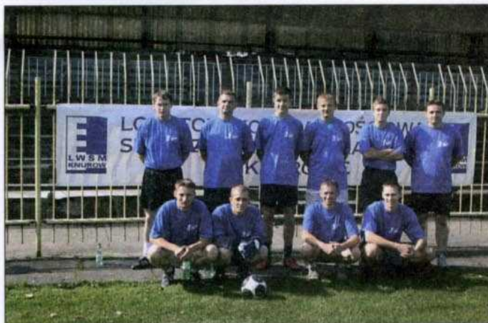
Reprezentacja LWSM.