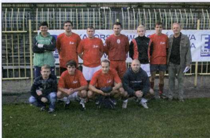
Zwycięzcy turnieju – Osiedle Szczygłowice.