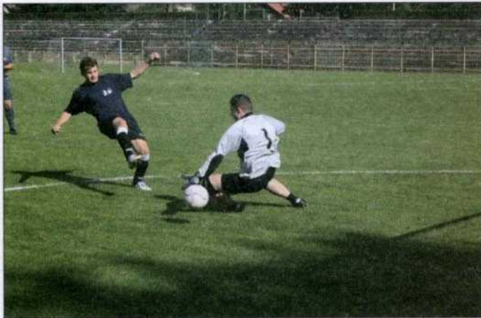
Tak padła jedna z bramek dla zespołu Osiedle Poczta w meczu z Bankiem Orzesko-Knurowskim.

Do rozgrywek na murawie, po której kilka miesięcy temu biegał Jerzy Dudek wraz ze swymi przyjaciółmi, przystąpiło osiem zespołów.