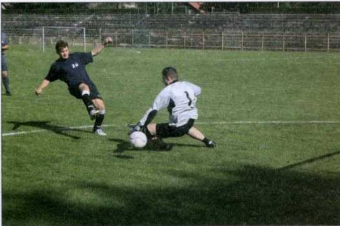
Tak padła jedna z bramek dla zespołu Osiedle Poczta w meczu z Bankiem Orzesko-Knurowskim.

Do rozgrywek na murawie, po której kilka miesięcy temu biegał Jerzy Dudek wraz ze swymi przyjaciółmi, przystąpiło osiem zespołów.