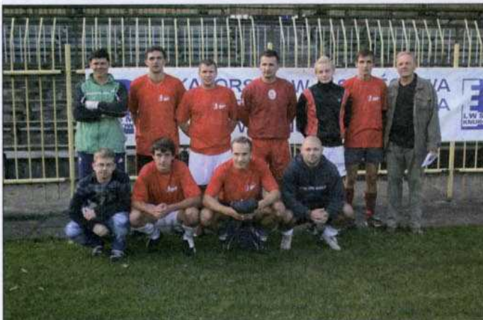
Zwycięcy turnieju – Osiedle Szczygłowice.