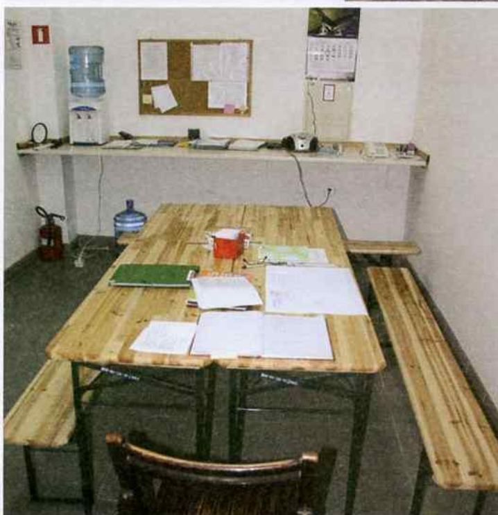
W tym miejscu spotykają się konserwatorzy przed podjęciem pracy