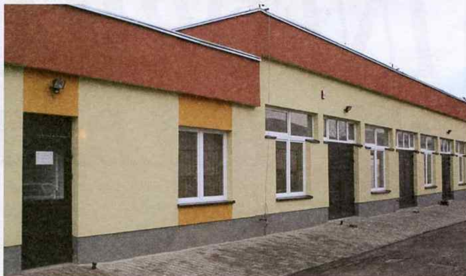
Siedziba „Grupy konserwatorów” z zewnątrz

Od kilku miesięcy pracownicy naszego Działu Technicznego „Grupa konserwatorów” mają do dyspozycji odnowione i przystosowane do ich potrzeb pomieszczenia pracy. Ich siedzibą jest obecnie budynek przy ulicy 1 Maja (obok stacji paliw), ten sam, w którym mieszczą się administracje naszych osiedli. Kompleks „Grupy konserwatorów” składa się m.in. z warsztatów ślusarsko-spawalniczych, hali ogólnobudowlanej, magazynu i części socjalno-biurowej.