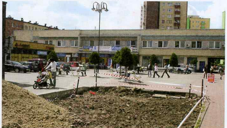
W tym miejscu kompleksu handlowego „Merkury” powstaną nowe miejsca postojowe dla samochodów

Drugim miejscem, gdzie można spotkać ekipę pracowników budowlanych jest rejon Alei Piastów