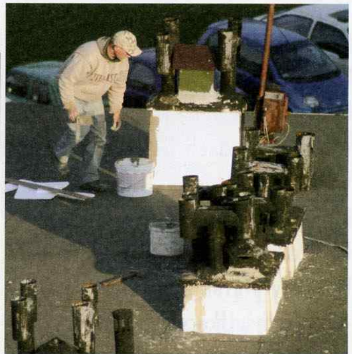
Dekarze korzystają ze sprzyjających warunków atmosferycznych i pracują na wielu dachach budynków administrowanych przez LWSM

W wielu miejscach na naszych osiedlach ze sprzyjających warunków atmosferycznych korzystają dekarze naprawiając pokrycie dachów.