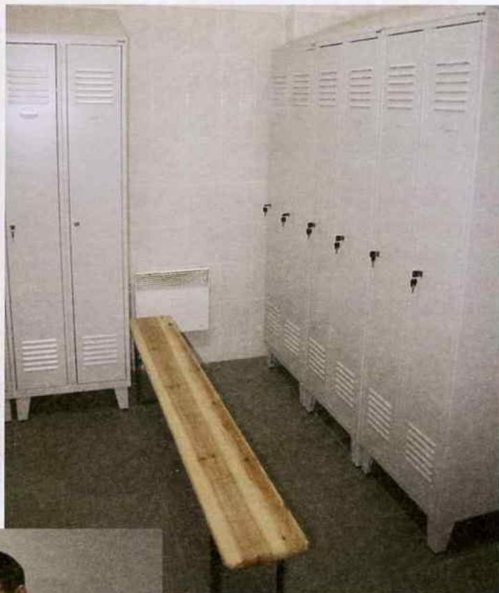
Fragment szatni