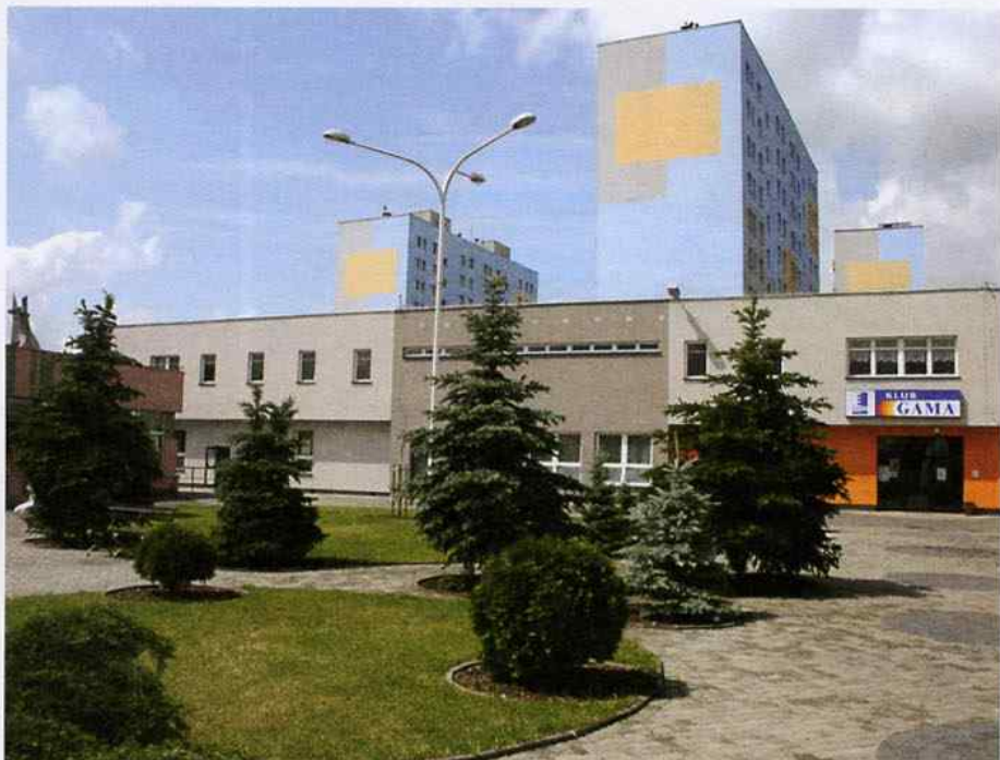
Odnowioną elewację ma od niedawna m.in. Klub GAMA

Obecnie cały ten fragment osiedla Wojska Wolskiego I zasługuje na miano jednego z najładniejszych zakątków naszego miasta.