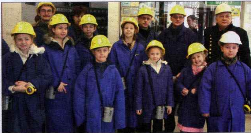
Jedną z atrakcji w czasie ferii było zwiedzanie kopalni Guido.

Wiele atrakcji czekało także na uczestników wycieczek do Tarnowskich Gór i Zabrza. Ta ostatnia była związana ze zwiedzaniem kopalni Guido.