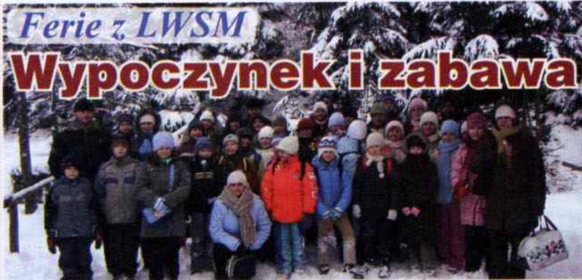
Uczestnicy wycieczki do Wisły.

J eżeli ktoś nie miał pomysłu na ciekawe spędzenie ferii mógł zaufać pracownikom Działu Kulturalnego naszej Spółdzielni, którzy zorganizowali szereg wycieczek i zajęć świetlicowych.