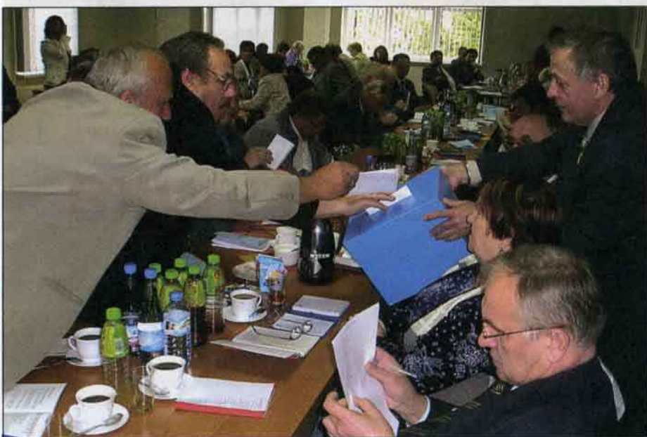
Głosujący niemal w stu procentach opowiedzieli się za udzieleniem absolutorium członkom Zarządu LWSM.

Członkowie naszej Spółdzielni ciesząc się z tego, co już zostało zrobione, dopominają się o kolejne przedsięwzięcia, które poprawią standard życia na naszych osiedlach.